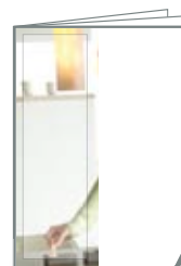
1/2 PAGE HAUTEUR 265 H X 90 L format utile