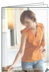
PAGE 285 H X 210 L pleine page 265 H X 190 L format utile